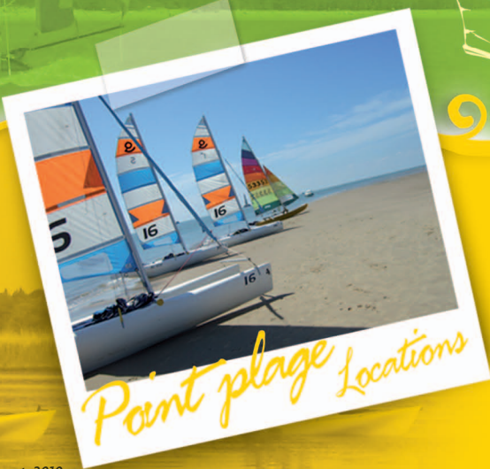
Point plage Locations